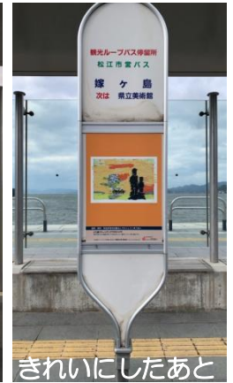
きれいにしたあと