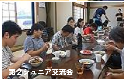
第2ジュニア交流会