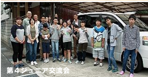
第4ジュニア交流会