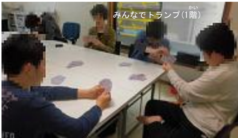
みんなでトランプ(1階)

4月末に島根県より正式に認可を受けて、いよいよ5月1日から第4ジュニアゆうあいがスタートしました。管理者は兼任〇〇〇〇、児童発達支援管理責任者は〇〇〇〇になります。これまでも第2ジュニアの別館として利用してこられた方も多いため、一見では変化が見えないかもしれませんが、1階奥の部屋に事務室と更衣室が作られたり、専用の棚が作られたりと、実は模様替えを進めていました。仕事依頼カードやポイントカードの活用も進めていきます。また第4ジュニアは土曜も運営することにしており、すでに5月、6月の楽しいプログラムを組み立てています。これから運営面を含めて、少しずつ第4ジュニアとしての特徴を出していければと考えています。