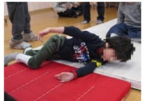
だい だい やく めい て おに いっしょうけんめいに 第1～第3キッズの約30名で手つなぎ鬼ごっこ！一生懸命逃げます！