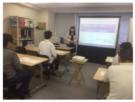
Willさんいんでの研修の様子

プロジェクトゆうあいでは、これまで障がい者就労継続支援事業を運営しており約30名の利用者さんが在籍していますが、昨年の12月より、「就労移行支援事業」を開始することになり、現在2名のご利用者さんを迎えています。この事業では、就労を希望する65歳未満の障がいのある方に対して、生産活動や職場体験などの機会の提供を通じて就労に必要な知識や能力の向上のために必要な訓練、就労に関する相談や支援を行うとともに、一般就労に必要な知識・能力を養い、本人の適性に見合った職場への就労と定着を目指しています。