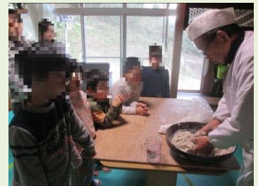
そば打ち職人さんに きていただきました。