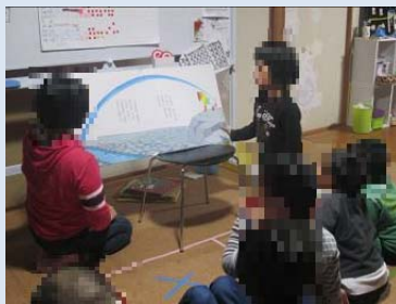
子ども達による読み 聞かせ