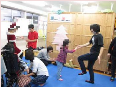
〇〇さんに来ていただき、 ブレインジム体操