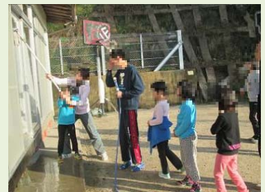
みんなで年末の大そうじ。