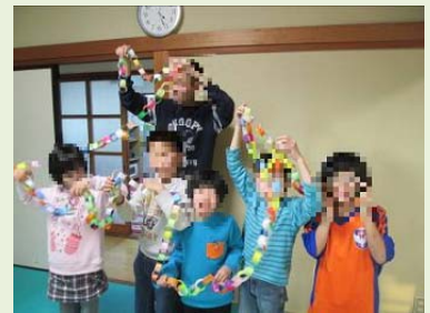
クリスマスの飾りを つきました