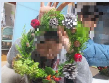
しぜんの材料でクリスマ スリース作り