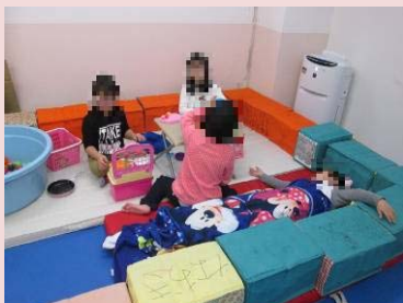
おままごと遊びをして います。