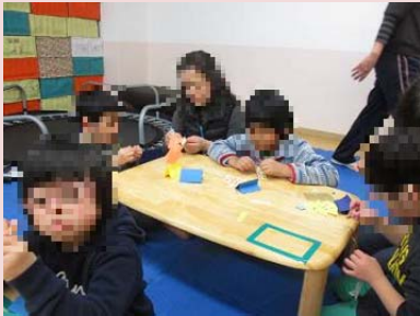
クリスマスの飾り作り かつどう 活動。