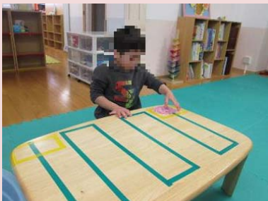
だい 台ふきの練習。緑 の線にそってふきます。