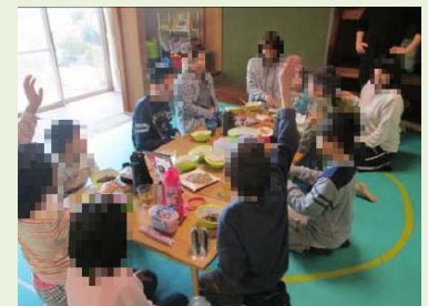
うちたてのそばをおいしくい ただきました。