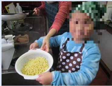
じもと やさいでグラタンを つきました。