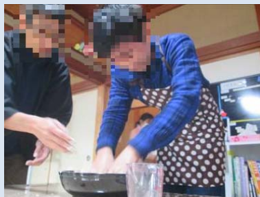
ねんまつ えんちょう いっしょに としこ 年越しそば作り