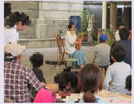
こうぼう かんりしゅ カラコロ工房で、管理者がラ イア（ たてごと えんそう 豎琴）を演奏。みんな でみにいきました。