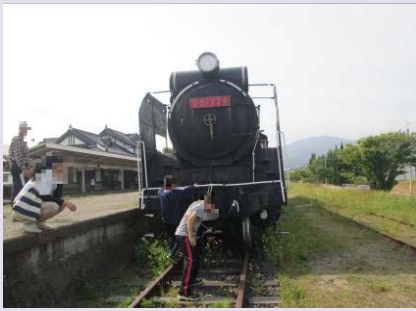
きゅうジェイアールたいしゅえき 旧 JR 大社 駅に行ったよ。