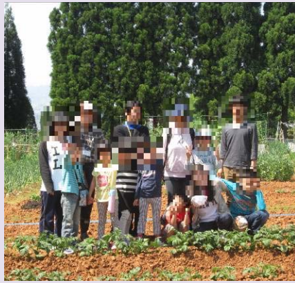
のうえん ゆうあい農園にやってきた！ ジャガイモはどけだな？