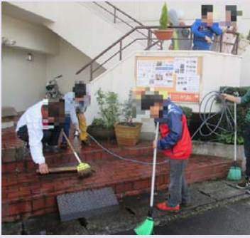
げんかん 玄関をみんなでそうじ。