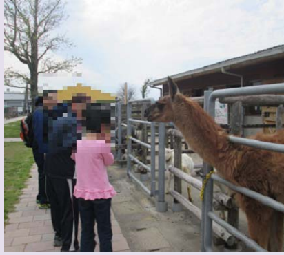
いすものうりん どうぶつえん 出雲農林ふれあい動物園