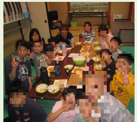
おやつまえ 前にみんなでチーズ!