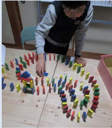
なが 長ーいドミノができました。