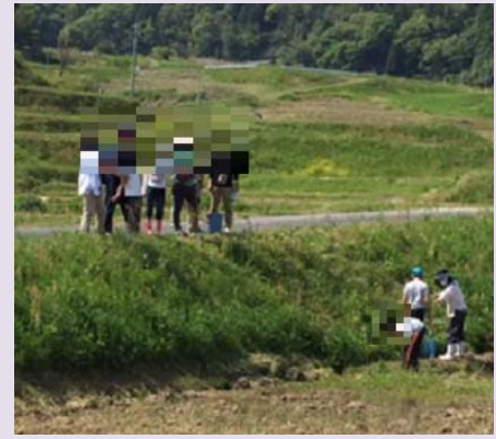
だいとう さんのうじ たなだ 大東・山王寺の棚田で、どじょう とイモリをとったよ。