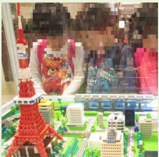
ひえづ 日吉津のイオンに行きま した。