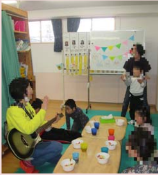
こんげつ たんじょうかい 今月の誕生会。ギター も登場でにぎやかに。