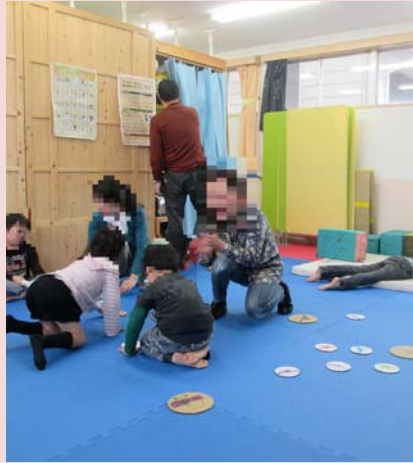
めんこひっくりかえ 返しゲーム でもり上がりました。