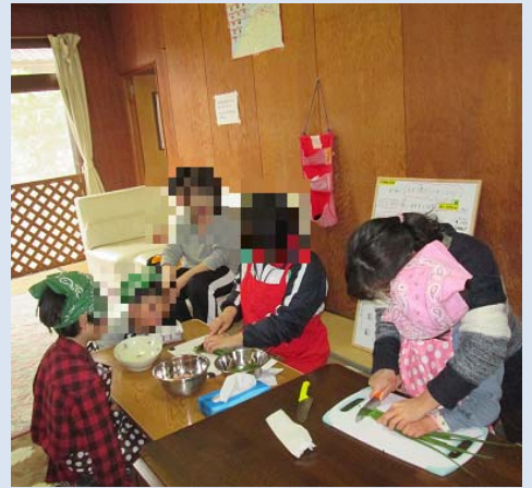
しょくいく や 食育でネギ焼きです。