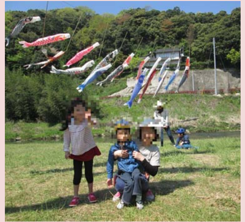
やくも いうがわ 八雲の意宇川にかかるたくさんの このぼりを見にきました