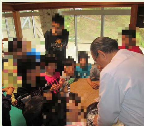
うどん うめいじん 打ち名人に 見入っています。