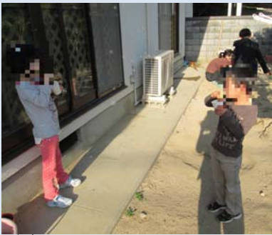
にわ 庭でシャボンだまふき をしています。