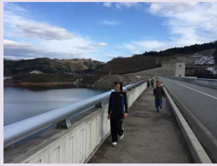
おくいすも たねしぜんはくぶつかん みぎ 奥出雲の多根自然博物館(右)、 おばら 尾原ダム(上)に行きました