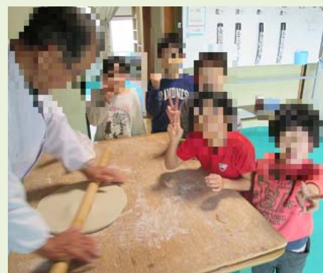
そば打ちのめいじん がやってきました