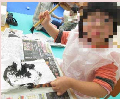
かきそめがうまくできて にっこり