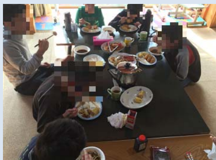
えんちょう とうち としこし 園長による手打ちの年越しそば を食べました