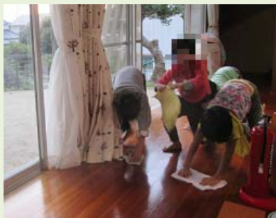
ろうか 廊下をそうきんがけです