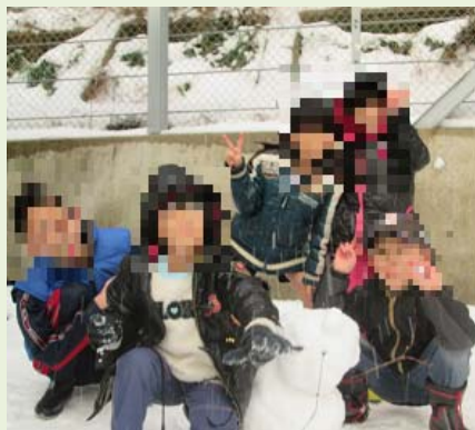
ゆき 雪あそびで、雪だるまを つく 作ったよ