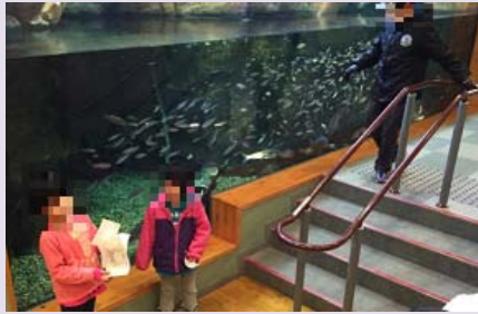
すいぞくかん 水族館のゴビウスに