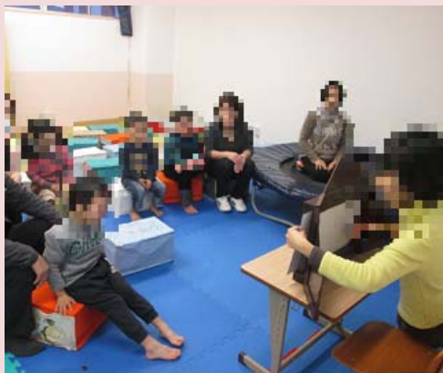
かみしばい 紙芝居をみんなで楽しみました