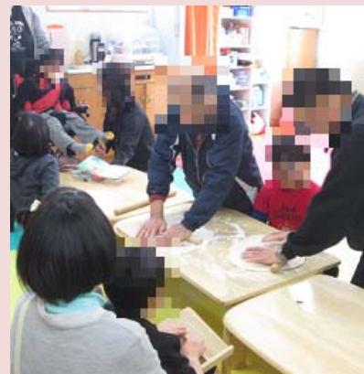
うどん打ちをみんなで体験！