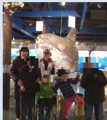
さかいみなと うみ 境港の海とくらしの しりょうかん えんぞく 史料館に遠足