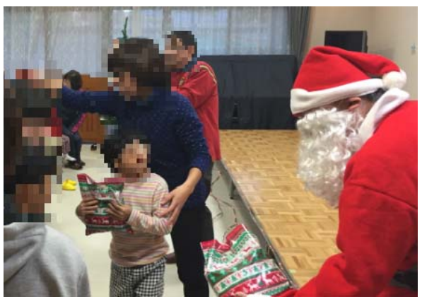
サンタさんが、お菓子のプレゼントを持ってあらわれました。