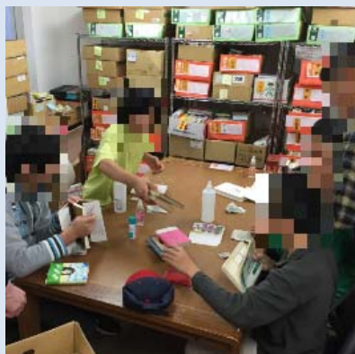
だい ちゅうがくせい いっしょ 第1キッズの中学生と一緒に ふるほん せいそうさきょうたいけん 古本の清掃作業体験