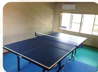
活動スペース (卓球)